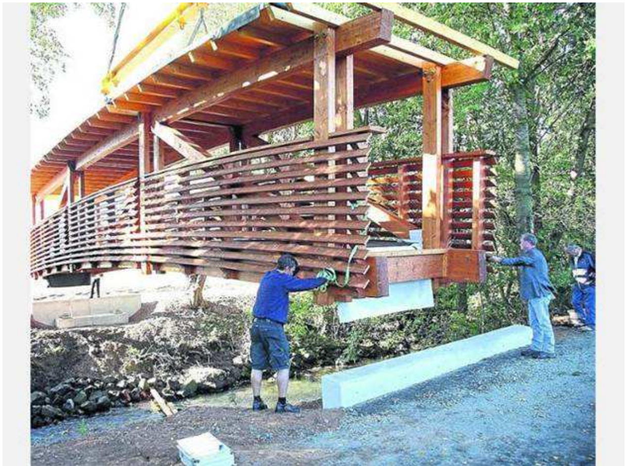
Foto: Brücke Rehheckenweg